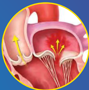
Prolaps regurgitasi mitral primer